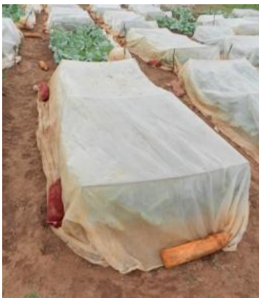
Photo 1 : Fermeture du filet anti-insectes avec des boudins de sable

Pour la fermeture de l'abri au niveau du sol, on peut enterrer ou placer des masses (pierres, sacs remplis de sable...) sur le filet anti-insecte.